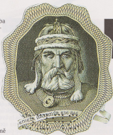
Mojmír I., první známý moravský kníže a zakladatel Velkomoravské říše, jak je vyobrazen na slovenské poštovní známce z roku 1944.

B yla to divoká doba pohanských Slovanů, čerstvě christianizovaných Germánů a neustávajících výbojů kmenových knížat, která se ve stínu Franské říše pokoušela posílit vlastní postavení a získat nová území. Ne každý mohl být vítězem. Sjednocování moravských kmenů a následný vznik silné středoevropské velmoci, kterou známe jako Velkomoravskou říši, provázely děje nepochybně stejně dramatické jako v Čechách 10. století, kde přemyslovská knížata soupeřila s kmeny Zličanů, Doudleboů nebo Charvatů. Avšak v případě Moravy nevíme o válkách mezi kmeny, údavnými reky